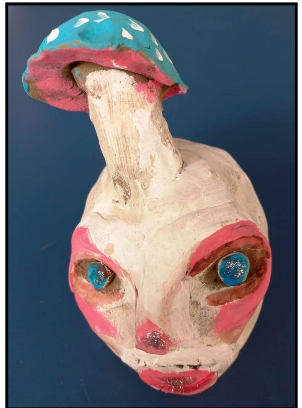
Escultura: Larissa M.