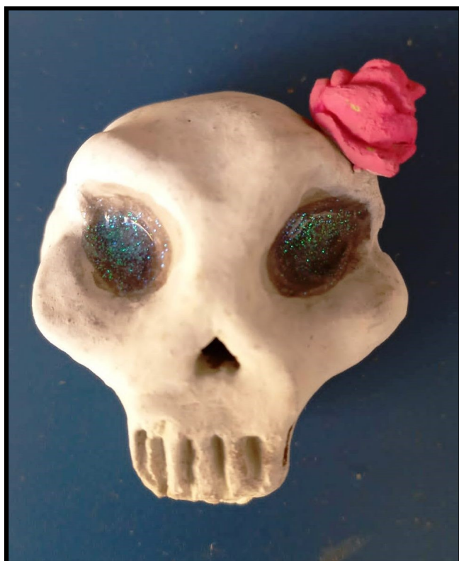
Escultura: Patrícia Correa