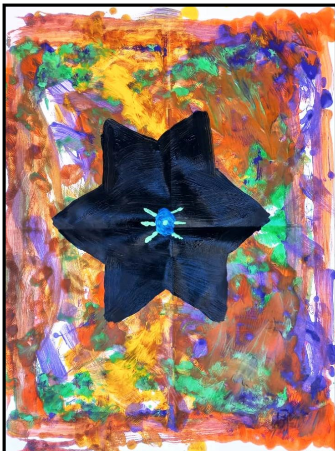
Ilustração: Daniel B.