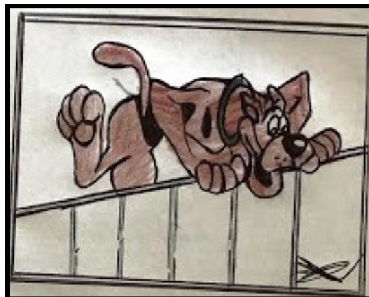
Ilustração: Roberto A.

As artes e os textos dessa edição foram criados por escritores e artistas da Clínica Ser .