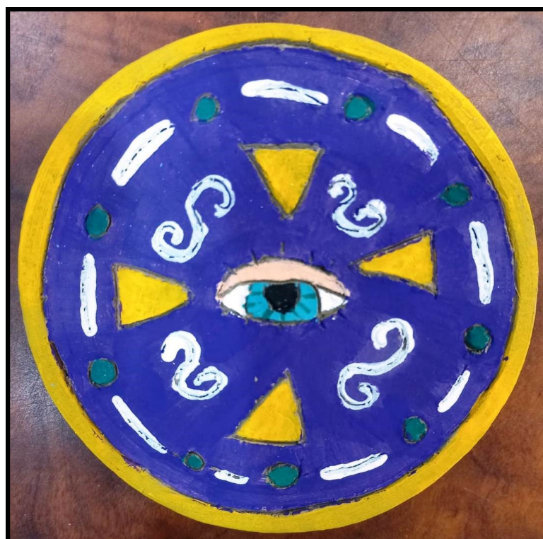
Escultura: Ana Clara