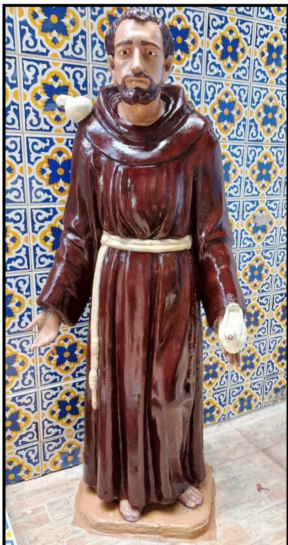
Restauração da imagem: Gisele | Arteterapeuta